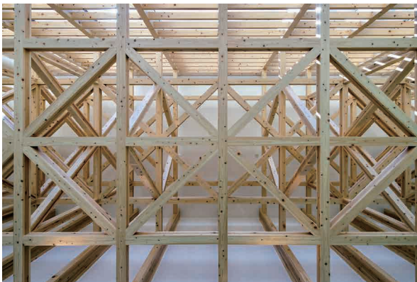
福岡ひびき信用金庫 中間支店