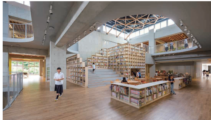
嘉麻市立稲築東義務教育学校